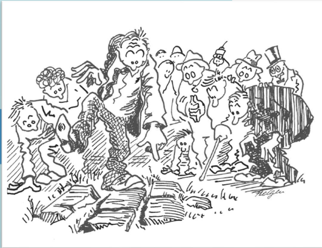
Figur av Geir Helgen