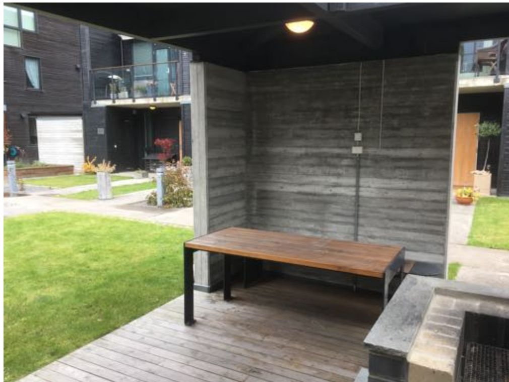
Ark: Brandsberg –Dahls arkitektkontor